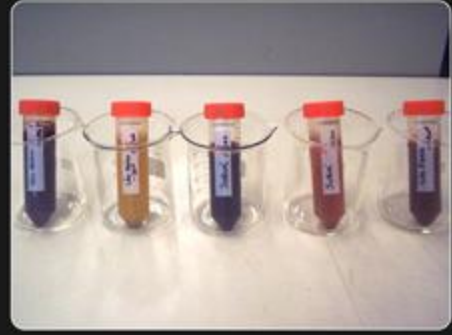
Figura 2 - Amostras de ayahuasca utilizadas no estudo. Procedência: 1 - Céu de Maria - São Paulo/SP; 2 - Céu de Midan - Sorocaba/SP; 3 - Céu do Junia - Cruzeiro do Sul/AC; 4 - Rodrigues Alves/AC; 5 - Céu da Luz Cheia - São Paulo/SP.