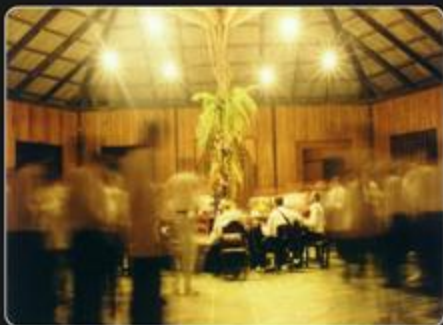
Figura 1 - Ritual de ayahuasca do CEFLURIS (Centro da Fonte Luz Universal Raimundo Inêu Serra, Igreja do Céu do Mapá - Pauini - AM.

SANTOS, R.; G. Ayahuasca: Chá de uso religioso, estudo microbiológico, observações comportamentais e estudo histomorfológico de cérebro de Murídeos ( Rattus norvegicus da linhagem Wistar). Brasília, 2004. 37p. Monografia apresentada ao Centro Universitário de Brasília – UniCEUB, 2006