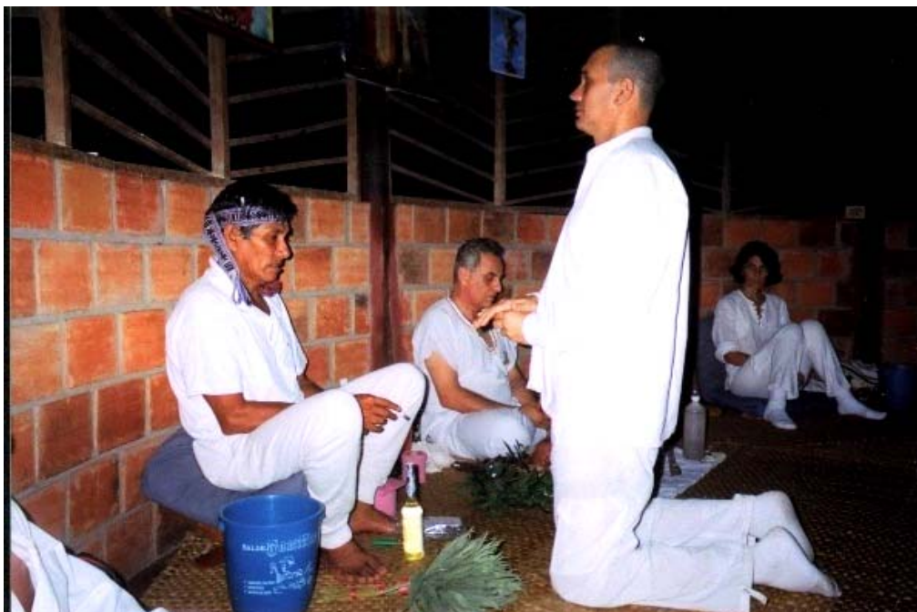
Abb.1 Patient (rechts) bei der Entgegennahme des Ayahuascatrunks zu Beginn der Zeremonie

Wenn nach Einschätzung des Heilers alle Teilnehmer ihren Prozess beendet haben, beschließt er die Sitzung durch das Singen eines ruhigen „ícaro“, bebläst die Teilnehmer nochmals mit Tabakrauch oder einem Duftstoff und spricht ein kurzes Dankgebet. Die Sitzungen enden meist in einer Atmosphäre von Ruhe, Dankbarkeit und dem Gefühl freundschaftlicher Verbundenheit zwischen den Teilnehmern. Anspannung und Angstsymptome sind nach Ayahuascasitzungen erheblich reduziert. (vgl. Fericgla, 1997)