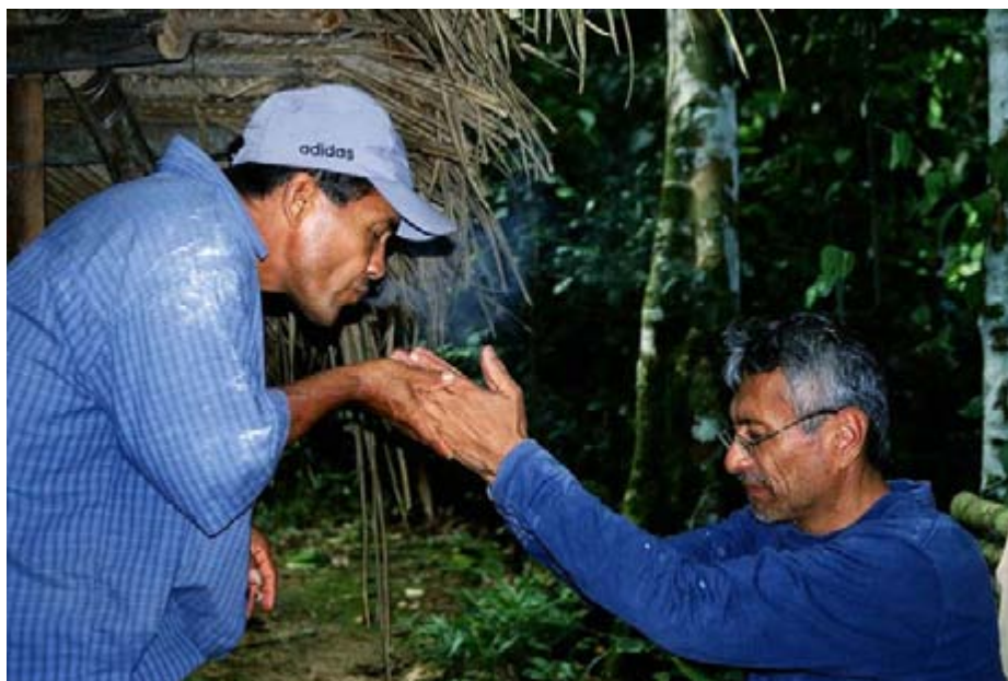
Abb. 2 Ein junger Heiler stabilisiert den Zustand eines Patienten durch Beblasen mit Tabakrauch nach der Einnahme des Pflanzenpräparats

Im Laufe der Therapie nimmt der Patient an mehreren achttägigen Diäten im Dschungel teil. Derartige „Retreats“ sind in der traditionellen amazonischen Medizin ein wichtiges Instrument zur psychophysischen Reinigung und essentieller Bestandteil der schamanischen Initiation. Für den Patienten bedeutet eine solche Diät eine Zeit in der Natur, die er ohne Kontakt zu anderen Menschen und fastend bzw. unter strenger Nahrungseinschränkung verbringt. Abhängig vom aktuellen Behandlungsstadium und der Persönlichkeitsstruktur des Patienten wird zur Unterstützung der Diät eine der so genannten „Meisterpflanzen“ 28 ausgewählt. Laut Torres (Experteninterview) sensibilisieren diese Pflanzen die Person und erzeugen eine psychosomatische Situation, in der das Unbewusste mobilisiert wird. Es sind jedoch keine halluzinogenen Pflanzen, sodass nicht von einem veränderten Bewusstseinszustand gesprochen werden kann. Ein Heiler bringt dem Patienten täglich das Pflanzenpräparat und, wenn dieser es wünscht, etwas zu Essen (Kochbananen, Reis oder Haferschleim ohne Salz, Zucker und Gewürze). Nach Abschluss der Diät halten die Patienten noch für zwei Wochen bestimmte Diätrestriktionen ein, um die weitere Wirkung der während der Diät eingenommenen Pflanze nicht zu behindern.