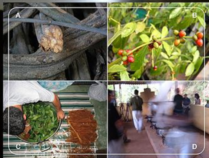
Figura 1: A - Banisteriopsis caapi . B - Psychotria viridis . C - Preparo da panela. Uma camada de cipó, outra de folha. D - Feto de Dalme (ayahuasca) do CEFLURIS. Céu de Maria - São Paulo - SP.

SANTOS, R.; G. Ayahuasca: Chá de uso religioso, estudo microbiológico, observações comportamentais e estudo histomorfológico de cérebro de Murídeos ( Rattus norvegicus da linhagem Wistar). Brasília, 2004. 37p. Monografia apresentada ao Centro Universitário de Brasília – UniCEUB, 2006