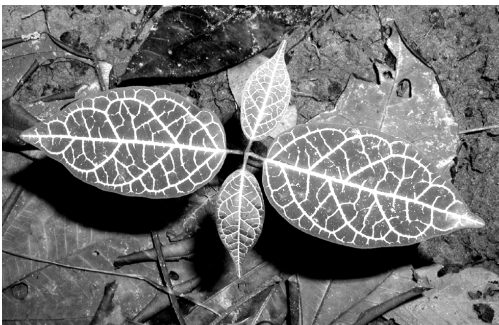
Figura 2: La planta ipo kené

pueblos vecinos (como los Asháninka, Yine, Kashinawa, etc.), el Inka personificaba una suerte de héroe cultural, ya que –entre otras cosas– había otorgado a otros pueblos el conocimiento sobre el cultivo de la yuca, la elaboración de distintos artefactos y la difusión de importantes eventos o procesos sociales (Bertrand-Rousseau 1984). Desde entonces, las mujeres Shipibo han seguido perfeccionando su arte a través de varias técnicas, sobre todo orientándose con la observación de la naturaleza: Muchas plantas o animales muestran kené , principalmente la anaconda ( rono ewa, ronin ) 9 que es considerada la “madre de los diseños”. El pez ipo lleva diseños en su cabeza. La planta ipo kené (fig. 2), con su mismo nombre indicando claramente su significado, entre otras, servía para eso, como las telas de araña, o las pisadas de las garzas en las arenas de las playas. Los hombres, por otro lado, se orientan mayoritariamente por las formas “artificiales” como la cruz, en sus tallados.