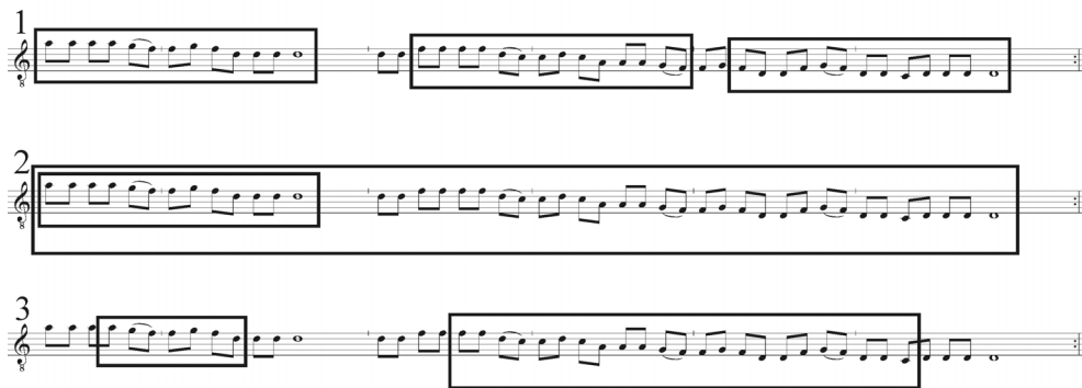
Figura 5: Primera secuencia de la canción kené betiki iká por Pascual Mahua Ochavano, con tres diferentes indicaciones de repeticiones autosimilares

Analizando la estructura (fig. 5), encontramos unos aspectos de autosimilitud dentro de la línea melódica y rítmica. En el primer sistema hemos marcado tres procesos que muestran similitud entre sí. Los tres procesos coinciden con las partes A, B y C, cada uno representando dos frases de las letras. En el proceso correspondiente a C, vemos que las primeras cuatro notas son diferentes, aparecen más grave que en los primeros dos procesos, reflejando el motivo. En el segundo sistema marcamos la parte A y la secuencia entera para mostrar la coincidencia en la línea melódica: La parte A aparece como una miniatura de la secuencia entera. Aquí, las notas ligadas dentro de la parte A funcionan como la nota prolongada en el final de la parte A dentro de la secuencia entera. En el tercer sistema hemos marcado el proceso de la caída melódica, que aparece en la parte A (baja-sube-baja) y en una forma más extensa entre B y C (baja-subebaja; baja-subebaja; SUBE-baja; baja). Ese último proceso aparece más saliente que los procesos en el primer sistema, debido al cambio de las cuatro notas en parte C, como mencionamos anteriormente. Cambiando esas notas, se completa el proceso de la caída melódica, sacrificando la similitud exacta entre las partes A, B y C como indicado en el primer sistema. Elegantemente, ese sacrificio resulta en la reflexión del motivo melódico.